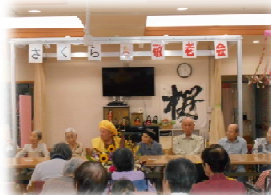
敬老会で長寿をお祝いました。一言ずつコメントを頂いて皆さんとても元気でした♪