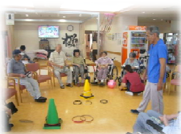
機能訓練ではグループに分かれて色々な運動を行っています。輪投げは集中力が高まりますね♪