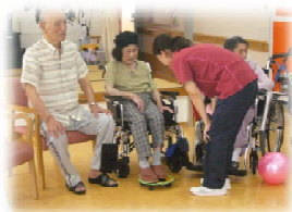
キャストがついた板を足で回すことで下肢が鍛えられます！腹筋も鍛えられますよ♪