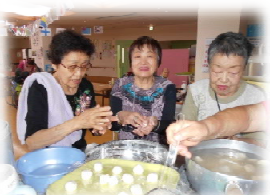
調理レクでお月見団子を作りました♪豆腐が入っていたのでとても食べやすかったです！