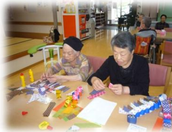
工作レクでは七夕に向けて飾りを作って頂きました。デイホールに飾りつけて一気に七夕らしくなりました。