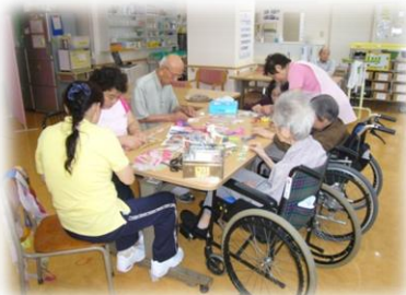
短冊に願い事を書いて頂きました。デイサービス入り口に展示してありますので是非ご覧ください。