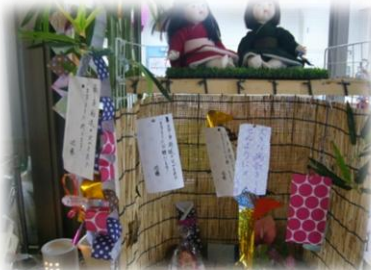
すだれと笹の葉を組み合わせ可愛く飾り付けしました♪入居者の皆様もお気に入りの作品です。