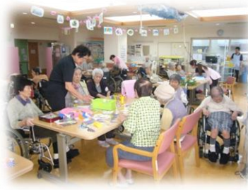
異なる柄の色紙を切って丸めて繋げて色鮮やかに仕上がりました！笹の葉にも飾り付けました。