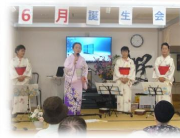
6月誕生会ではあやね会様にお越し頂き、三味線を披露して頂きました♪楽しい誕生会になりました。